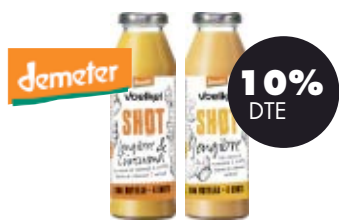
Shot de Gingebre / Shot de Gingebre i cúrcuma 280ml BIO Voelkel 4,40€ 4,89€