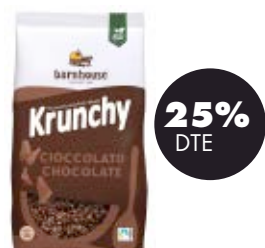
Krunchy xoco 750gr BIO Barnhouse 5,06€ 6,75€