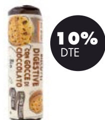
Galetes digestive xips xoco 250gr BIO Fior di Loto 2,69€ 2,99€