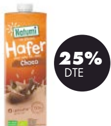
Beguda civada xocolata 1l BIO Natumi 1,84€ 2,45€