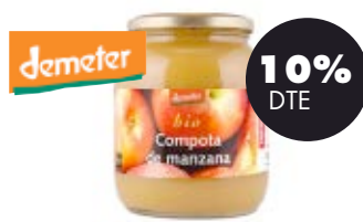
Compota de poma 700gr BIO Machandel 2,97€ 3,30€