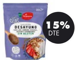
Vitaseeds 5 llavors i nabius 300gr BIO El Granero 6,84€ 8,05€