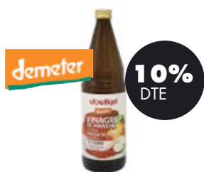
Vinagre de poma sense filtrar 750ml BIO Voelkel 4,22€ 4,69€