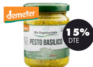
Salsa pesto basilic vegà 140gr BIO Organica Italiana 2,97€ 3,49€