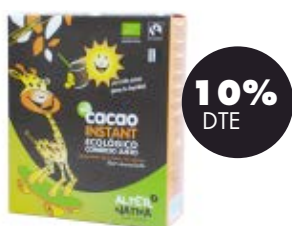
Cacau instant 750gr BIO Alternativa3 7,79€ 8,65€