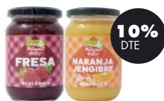
Compota de maduixa / taronja i gingebre 280gr BIO La Finestra 4,01€ 4,45€