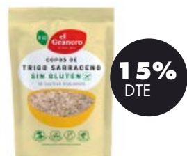
Flocs de fajol sense gluten 450gr BIO El Granero 4,24€ 4,99€