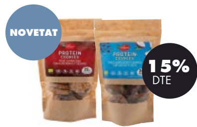
Cookies Protein ametlla i sèsam / Cacau i coco 130gr BIO El Granero 3,32€ 3,90€