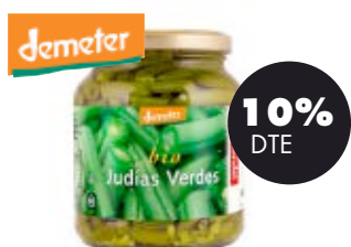
Mongetes verdes 340gr BIO Machandel 2,25€ 2,50€