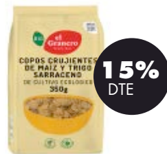
Flocs cruixents de blat de moro i fajol 350gr BIO El Granero 3,82€ 4,49€