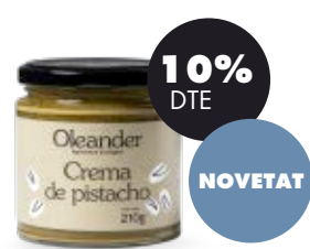
Crema de festuc torrat 210gr BIO Oleander 11,51€ 12,79€