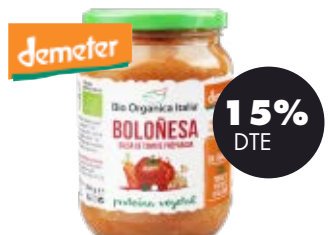
Salsa de tomàquet bolonyesa vegana 350ml BIO Organica Italiana 2,87€ 3,38€