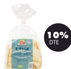
Mini crackers 100% espelta 250gr BIO La Finestra 2,66€ 2,95€