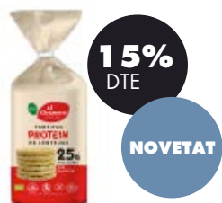
Coquetes de lleties amb proteïna 125gr BIO El Granero 2,20€ 2,59€