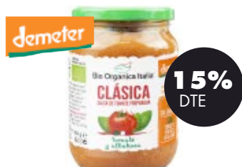
Salsa de tomàquet clàssica 325ml BIO Organica Italiana 2,80€ 3,29€