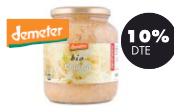
Xucrut 680gr BIO Machandel 3,29€ 3,65€