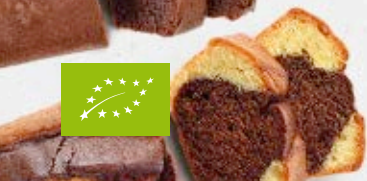
Pa de pessic màrmol blat espelta