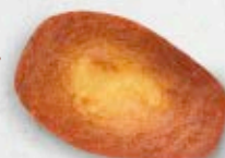
de blat espelta 100%