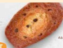
de blat sarraí 100% amb trossets de xocolata