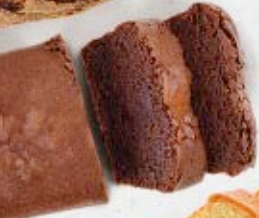
Pa de pessic xocolata fondant

RECEPTA ORIGINAL ELABORADA AMB CASTANYES ECOLÒGIQUES