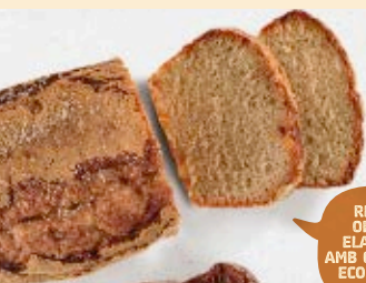
Pa de pessic castanyes

15% DTE Pa de pessic de màrmol d'espelta 250gr BIO Biocop 4,74€ 5,58€