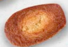
amb trossets de xocolata