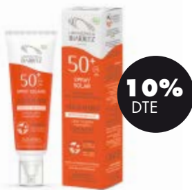
Esprai solar cara&cos SPF50+ 100ml BIO Lab.Biarritz 24,75€ -27,50€