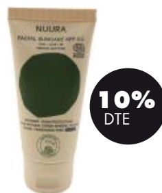
Crema solar facial amb color SPF50 50ml BIO Nuura 21,42€ -23,80€