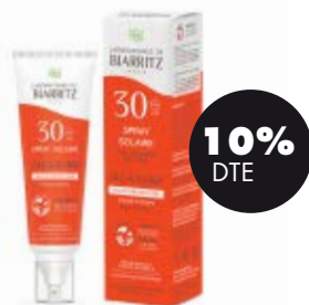
Esprai solar cara&cos SPF30 100ml BIO Lab.Biarritz 21,15€ -23,50€