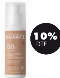
Crema facial color beige SPF50 BIO Lab.Bitarritz 22,95€ -25,50€