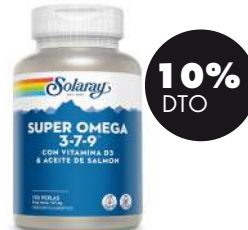
Super Omega 3-7-9 120 perlas Solaray 20,66€ 22,95€