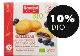
Galletas de arroz y maíz rellenas de arándanos s/gluten 200g BIO Germinal