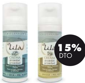
Crema proedad piel normal-seca / Crema proedad piel seca -muy seca 50 ml Lila* 26,95€ 31,70€

Te invitamos a unirse a nuestra filosofía, a hacer este cambio de armario cosmético y, sobre todo, a que este verano "aliméntate tu salud" integral para ver y sentir tu piel mejor que nunca. Y recuerda #alimentatusalud