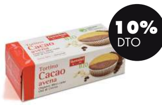
Pastelillo de avena con cacao s/gluten 180g BIO Germinal