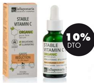
Vitamina C estable 30ml BIO La Saponaria 8,91€ 9,90€