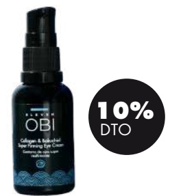
Contorno de ojos con colágeno y bakuchiol 20ml BIO Eleven Obi 36,86€ 40,95€