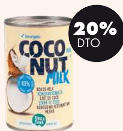
Leche de coco 400ml BIO Terrasana 2,95€ -3,60€