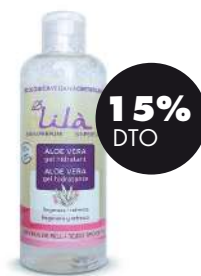
Gel hidratante de Aloe vera s/perfume 250ml BIO Lilà 11,39€ 13,40€