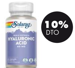
Hyaluronic Acid 60mg 30 cáp. Solaray 35,71€ 39,68€