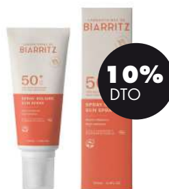
Espray solar cara y cuerpo SPF50+ 100ml BIO Laboratorios Biarritz 24,75€ 27,50€