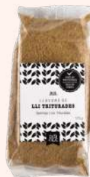
Semillas de lino trituradas 175g BIO Rel 2,60€