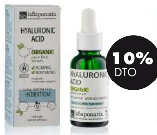
Ácido hialurónico 30ml BIO La Saponaria 8,91€ 9,90€