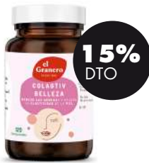
Colagtiv Belleza 120mg 750 cáp. El Granero 16,57€ 19,49€