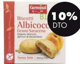
Galletas rellenas albaricoque s/gluten 200g BIO Germinal