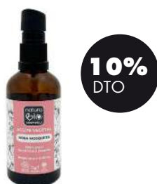
Aceite vegetal de Rosa Mosqueta 75ml BIO Naturabio 17,96€ 19,95€