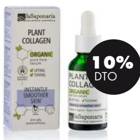
Colágeno vegetal 30ml BIO La Saponaria 8,91€ 9,90€

Cuando la piel necesita nutrición y protección sin aportar sensación de pesadez, recomendamos los aceites vegetales de Naturabio . El aceite de rosa mosqueta bio y el aceite de argán bio te aportan ácidos grasos esenciales y antioxidantes que ayudan a reforzar la barrera cutánea y a mantener la flexibilidad. Si buscas una hidratación más ligera, el aloe vera calma y refresca la piel, especialmente después del sol o en momentos en los que la notas más sensible.