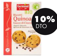
Galletas quinoa con chips choco s/gluten 250g BIO Germinal