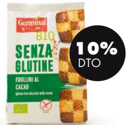
Galletas cacao y vainilla s/gluten 250g BIO Germinal