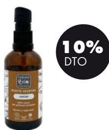
Aceite vegetal de Argan 75ml BIO Naturabio 17,96€ 19,95€