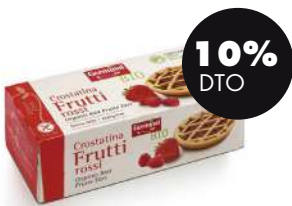
Tartalena frutos rojos s/gluten 200g BIO Germinal