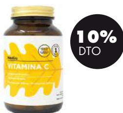
Vitamina C Plus 1000mg 90 cáp. Nativo 17,96€ 19,95€