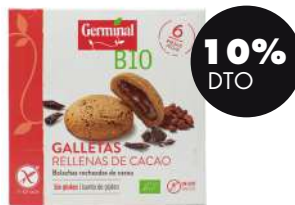
Galletas rellenas cacao s/gluten 200g BIO Germinal