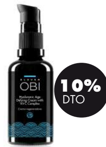
Crema regeneradora con ácido hialurónico y vitamina C 50ml BIO Eleven Obi 35,06€ 38,95€