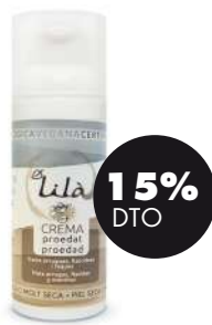
Crema proedad piel seca -muy seca 50 ml Lila 26,95€ 31,70€