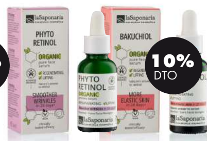
Bakuchiol / Fitoretinol 30ml BIO La Saponaria 8,91€ 9,90€