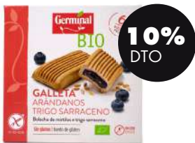
Galletas arándano y trigo sarraceno s/gluten 200g BIO Germinal

Una forma de priorizar los vegetales y legumbres en tu dieta es a través de las hamburguesas vegetales. Las de Germinal bio son sin gluten y combinan ingredientes proteicos con hortalizas para que tengas una combinación que aporte muchos nutrientes en un solo plato. Son muy fáciles de cocinar, sólo necesitas 2 minutos. La mejor burger de Germinal para empezar esta transición es la de remolacha y lentejas rojas.