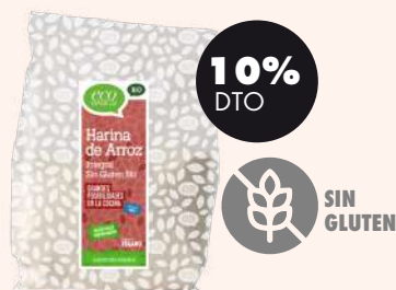
Harina de arroz s/gluten 500g BIO Eco basics 2,84€ -3,15€